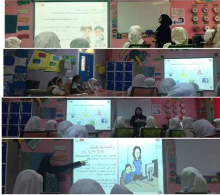
مدرسة المنهل الابتدائية للبنات