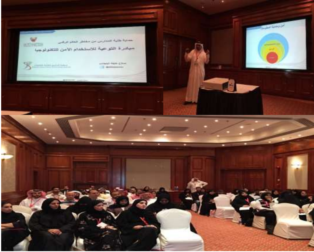
محاضرة جمعية البحرين لتقنية المعلومات في مؤتمر الخليج لمستقبل التكنولوجيا في التعليم