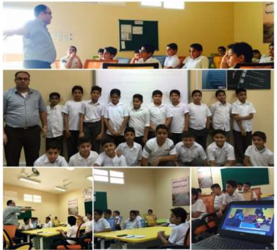
مدرسة الضياء الابتدائية للبنين