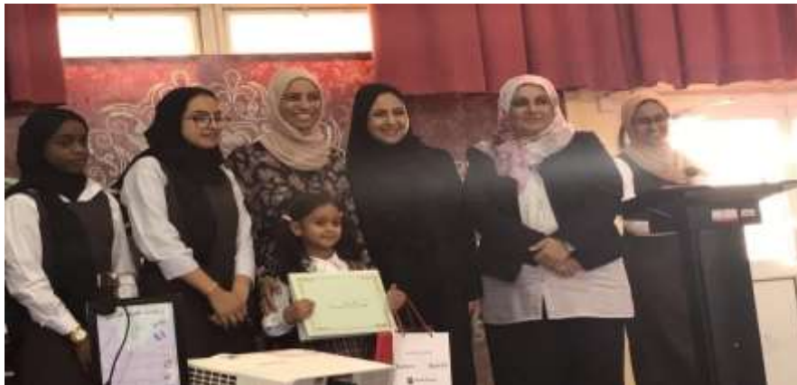
فعالية "نحو مجتمع معرفي تقني" بمدرسة حليلة السعدية الإعدادية للبنات