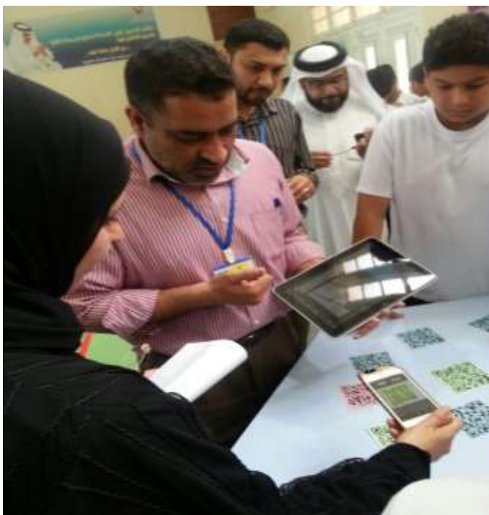
معرض تطبيق مشروع الاستعمال الآمن للتكنولوجيا بمدرستي أم سلمة الإعدادية للبنات والرفاع الإعدادية للبنين