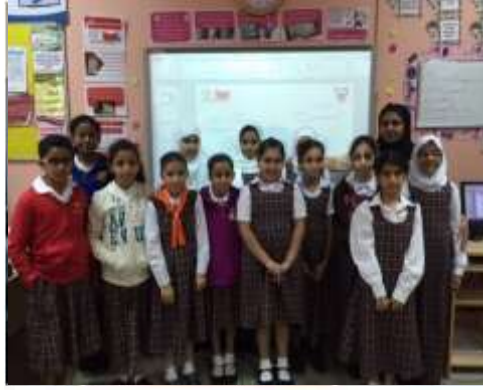
مدرسة النزهة الابتدائية للبنات