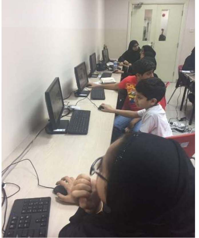
ورش التعريف بمشروع الاستعمال الآمن للتكنولوجيا بمركز رعاية الطلبة الموهوبين